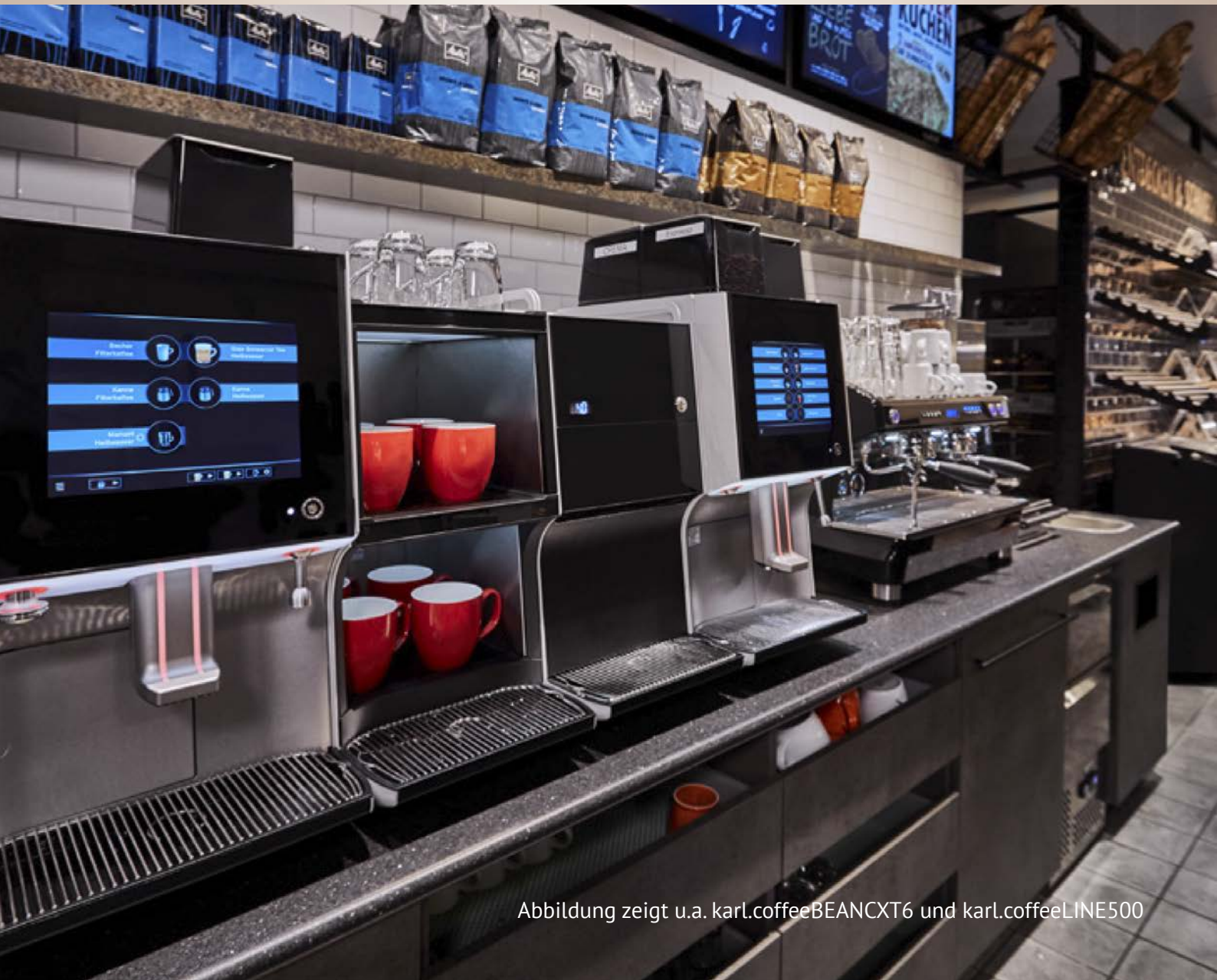
Abbildung zeigt u.a. karl.coffeeBEANXCT6 und karl.coffeeLINE500